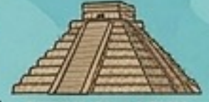
DZIBILCHALTUN EK' BALAM